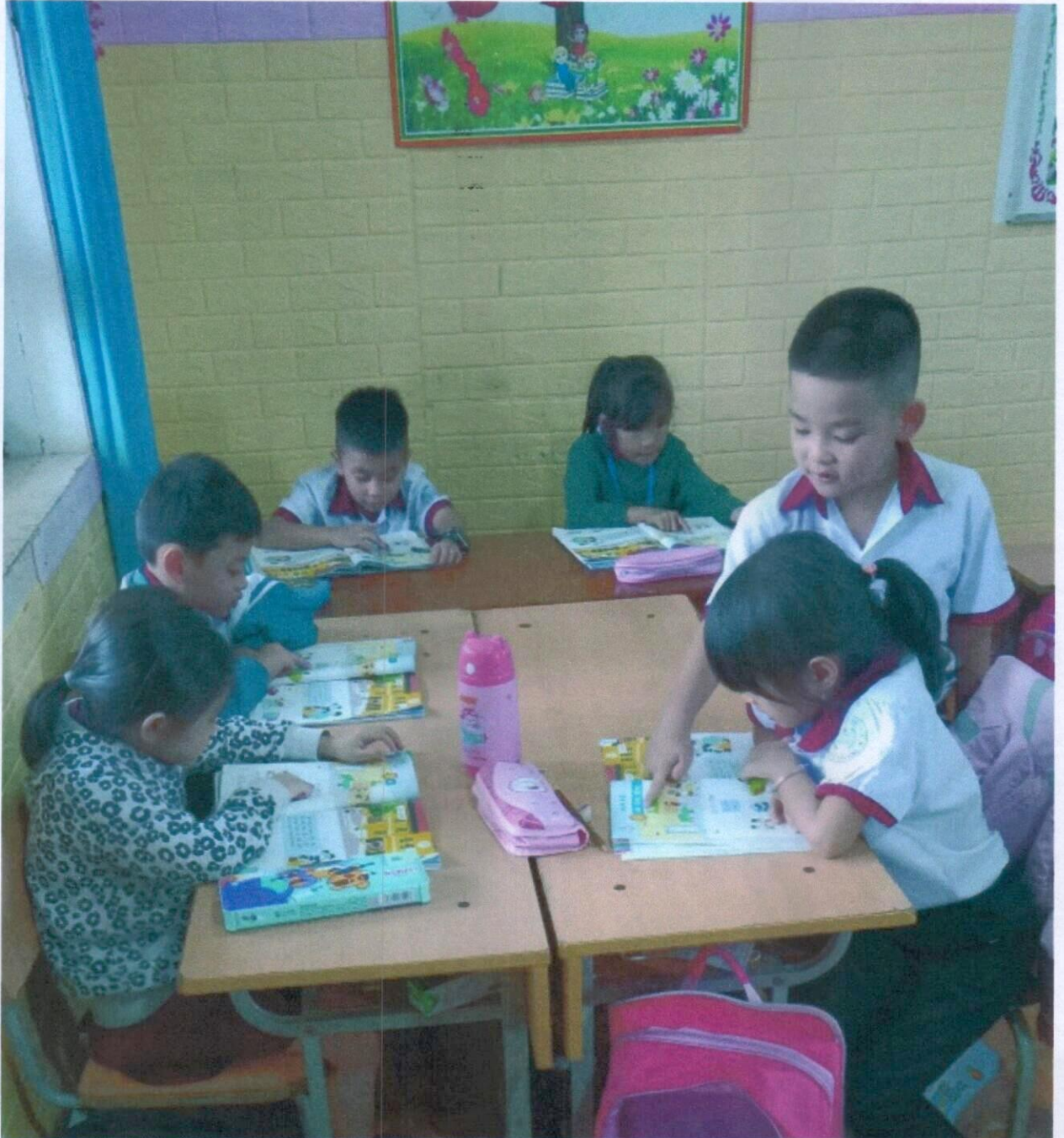
Ban cán sự lớp kiểm tra bài cũ

Ví dụ: Tôi sẽ hướng dẫn học sinh cách kiểm tra sách vở, đồ dùng học tập của các bạn như sau: Trước tiên tôi sẽ kiểm tra sách vở, đồ dùng của các bạn trong ban cán sự. Sau đó, để ban cán sự kiểm tra các nhóm trưởng, nhóm trưởng sẽ có trách nhiệm kiểm tra các bạn trong nhóm mình và báo cáo về ban cán sự. Cuối cùng, ban cán sự sẽ báo cáo với giáo viên.