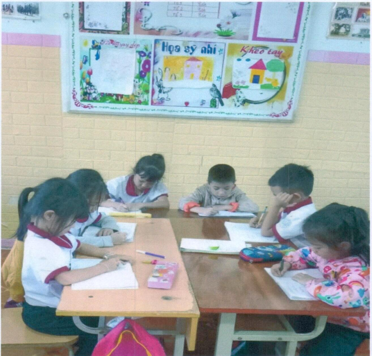
Học sinh ngồi viết bài đúng tư thế

thoải mái) và yêu cầu các em thực hiện đúng tư thế ngồi viết vừa nêu. Từ đó tạo thành thói quen ngồi viết đúng cho học sinh.