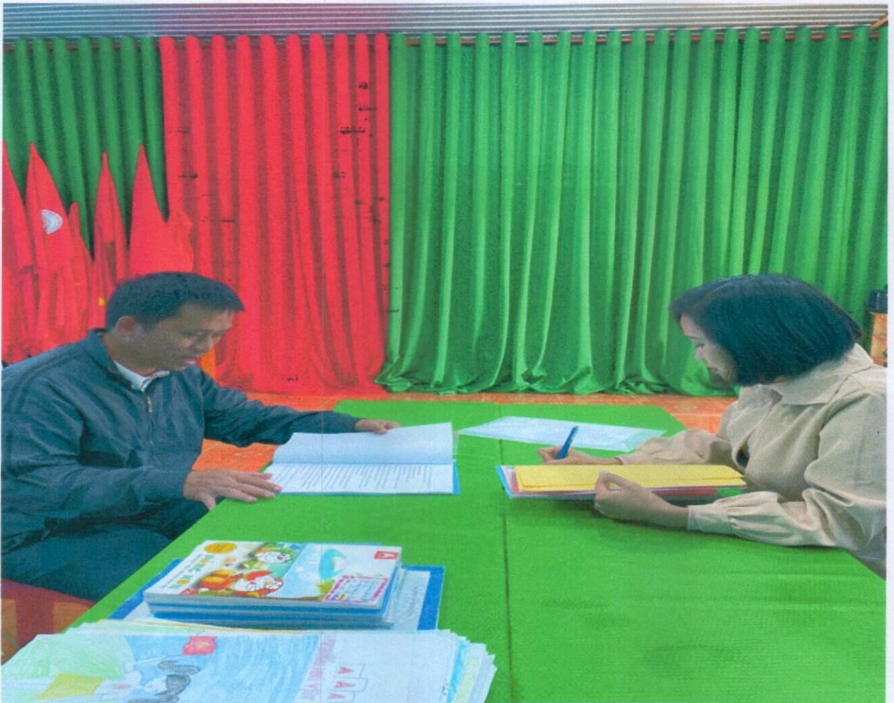
Gặp gỡ, trao đổi với Tổng phụ trách Đội

Ngoài ra tôi còn gặp gỡ, trao đổi với Tổng phụ trách đội và Sao đỏ phụ trách lớp mình để nắm bắt việc thực hiện nội quy học sinh lớp mình. Từ đó, tôi tìm hiểu được nguyên nhân lớp mình bị trừ điểm thi đua, nắm bắt cụ thể học sinh nào vi phạm để nhắc nhở kịp thời.