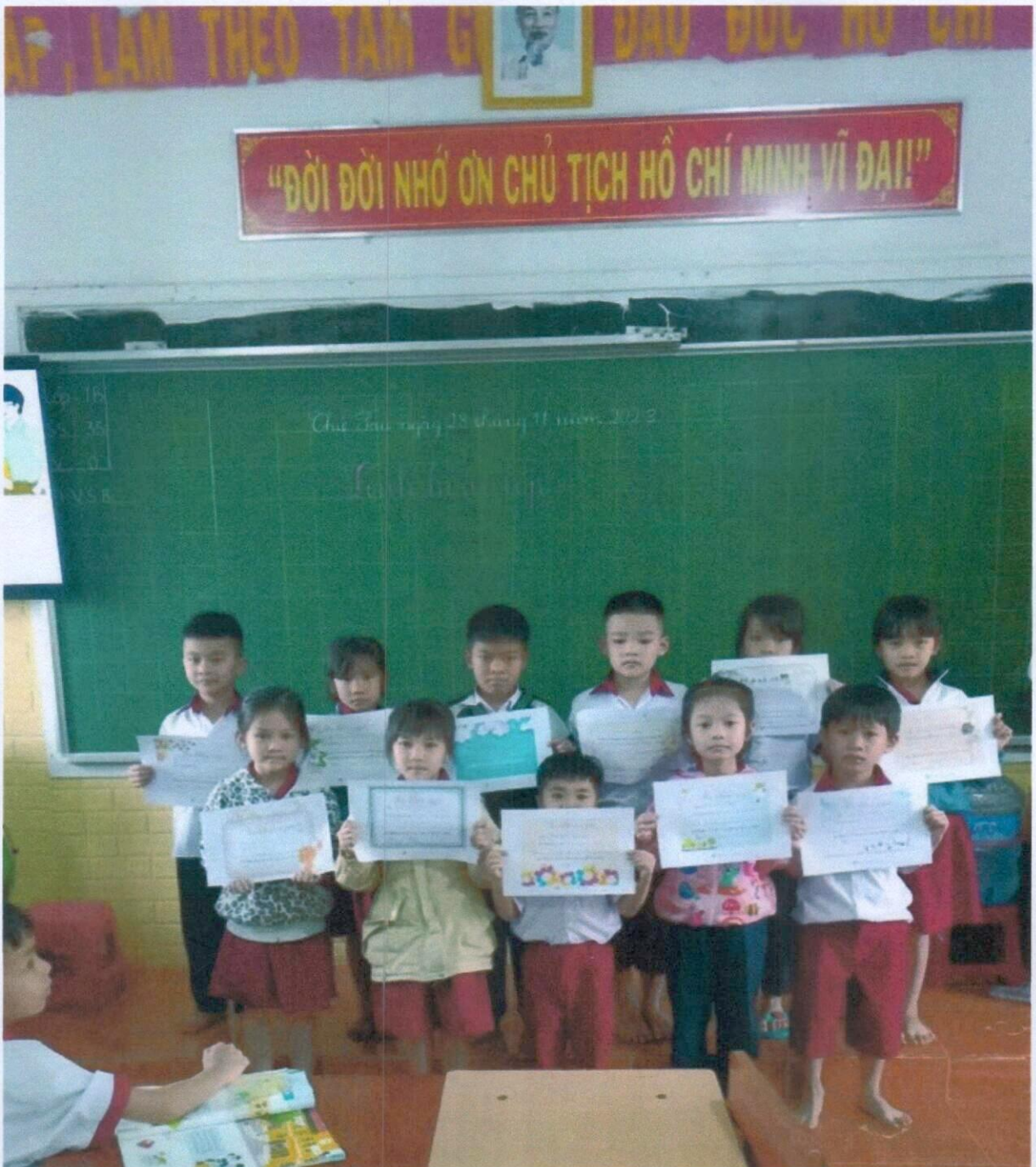
Học sinh nhận thư khen trong tiết sinh hoạt lớp

việc thực hiện nền nếp tôi sẽ tuyên dương học sinh đó ngay lập tức và có hình thức khen thưởng động viên là tặng sticker cho các em. Sau mỗi lần như thế tôi nhận thấy học sinh rất vui vẻ, thích thú và cố gắng, tích cực hơn trong các hoạt động. Trong các tiết sinh hoạt lớp vào cuối tuần tôi sẽ có thư khen ngợi đối với những học sinh thực hiện tốt các nền nếp học tập của lớp. Đây không chỉ là hình thức tuyên dương học sinh mà còn là cách để tôi động viên, khuyến khích các em cố gắng hơn nữa trong việc rèn luyện nền nếp. Bởi lẽ, khi học sinh thấy bạn được nhận Thư khen, bản thân các em khác cũng muốn được nhận nên các em sẽ cố gắng nhiều hơn. Đối với những học sinh thường xuyên vi phạm, tôi sẽ nhắc nhở, động viên, khích lệ hoặc đưa ra những biện pháp phù hợp với từng học sinh để giúp các em xây dựng được nền nếp học tập cho bản thân mình.