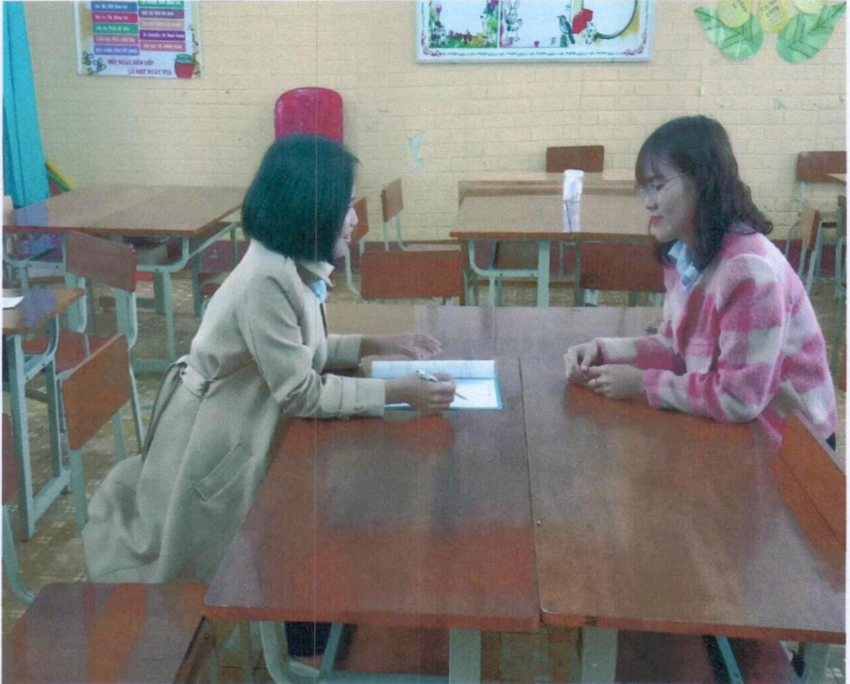
Gặp mặt trao đổi với phụ huynh học sinh.

Đối với những học sinh thường xuyên vi phạm nội quy lớp học tôi sẽ liên hệ với phụ huynh hoặc có những buổi trao đổi trực tiếp về tình hình học tập của học sinh đó để cùng với phụ huynh tìm cách khắc phục.